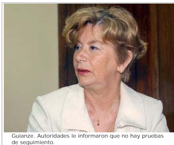
Guianze. Autoridades le informaron que no hay pruebas de seguimiento.

Guianze ha sido objeto de duros ataques por parte de los militares a quienes ella procesó en el marco de las investigaciones sobre las violaciones a los derechos humanos ocurridas en dictadura. El caso, que generó inquietud en filas políticas y judiciales, será abordado por Vomero en las próximas semanas, quien deberá resolver si vuelve a citar a Medina y el resto de los militares.