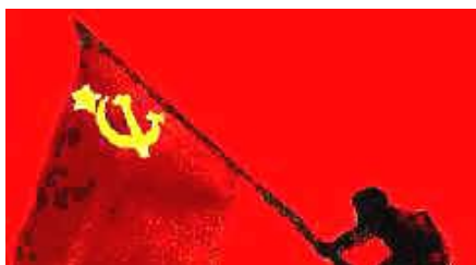
Fidel Castro junto a Kruschev en el Kremlin, Mao y la bandera Soviética.

Todas combinan tres elementos; el militar, las masas, y el partido, pero se diferencian en cual de ellos realizan su esfuerzo por estimarlo fundamental. Los Movimientos Revolucionarios (MMRR) que actuaron en el país en el siglo pasado han cambiado sus estrategias pero no sus objetivos, y van conduciendo al país a una anarquía.